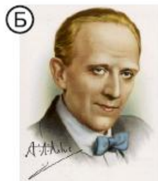
Алан Александр Милн